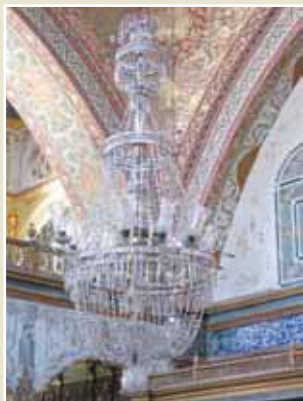
Palais de Topkapi, Istanbul