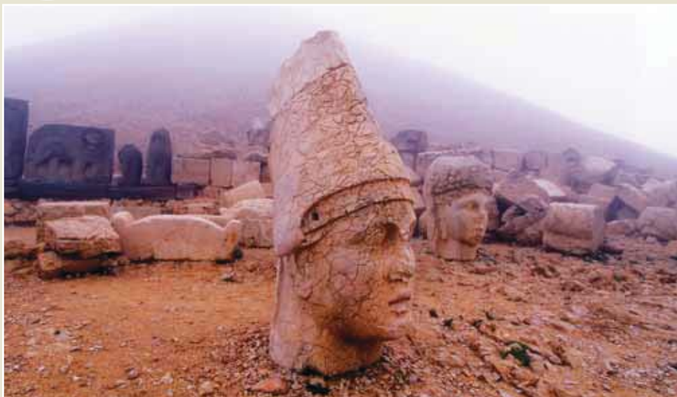
Mont Nemrut