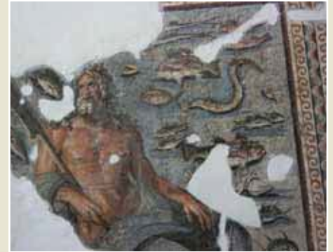
Musée des Mosaïques, Antakya