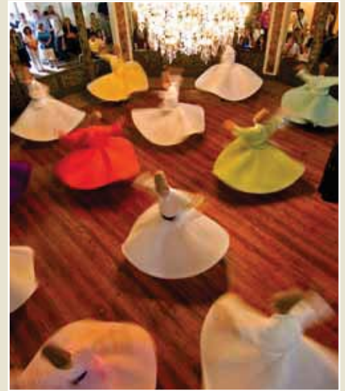
Derviches tourneurs