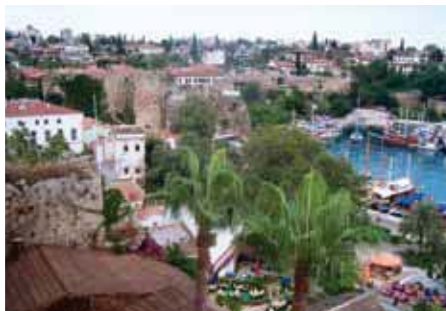
Port d'Antalya, dans la vieille ville Kaleici.

Le matin, à travers la plaine côtière de Pamphylie , route vers Perge et visite de cette ville antique hellénistico-romaine avec son stade, sa voie à colonnades, son théâtre. Continuation vers Aspendos dont le théâtre du IIe siècle est le mieux préservé des théâtres romains d'Asie Mineure. Après déjeuner, retour à Antalya pour une promenade dans les ruelles de la pittoresque vieille ville (Kaleici) aux maisons typiques en bois qui dominent le port de plaisance pour y découvrir la Porte d'Hadrien , le Minaret Cannelé , le minaret tronqué , la Tour d'Hidirlük ... Dîner et logement, hôtel Grida City 4* .